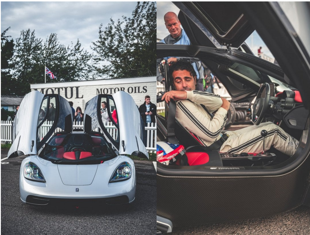
Gordon Murray hat uns einen ersten dynamischen Eindruck des T.50 mit Dario Franchitti am Steuer geschenkt, während seine jüngste Entwicklung mit gut über 10.000 Umdrehungen um Goodwood herum tobte. Zugleich wurde eine statische Version des Niki Lauda-Modells geboten, die ausschließlich auf den Track-fokussiert ist.