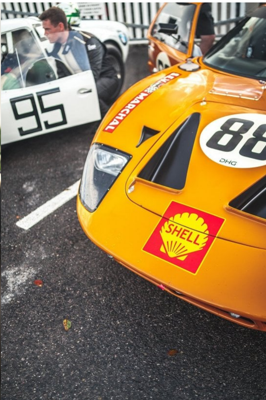
Weil das Starterfeld 58 Fahrzeuge umfasste, wurden diesmal zwei Durchgänge gefahren, bei denen die Teilnehmer nach Motorgröße eingeteilt wurden. Die ersten 15 jedes Durchgangs gingen dann beim 30 Autos umfassenden Endlauf an den Start. Übrigens das letzte des fantastischen Members 's Meeting, und wieder vor der Kulisse der letzten Sonnenstrahlen.