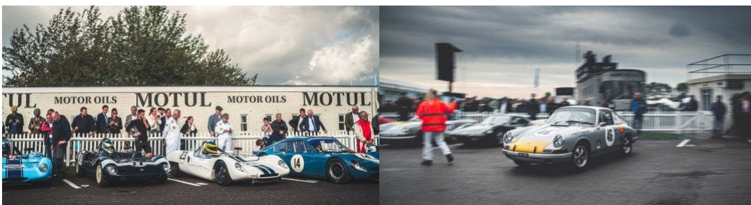
Die während wurden während der einzelnen Events und quer über alle Grids packend ausgetragen. Die MG kämpften um Mittelplätze und die Porsche schlängelten erbittert um Plätze an der Spitze des Felds. Der Pierpont Cup am Samstagabend bescherte jede Menge Nervenkitzel: Modelle wie Mustang, Falcon und Galaxie kämpften hart um jeden Meter vor der untergehenden Sonne.